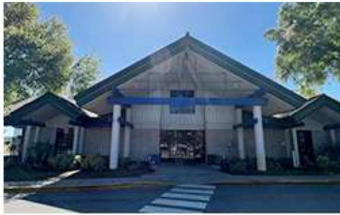
Parque en Land O Lakes