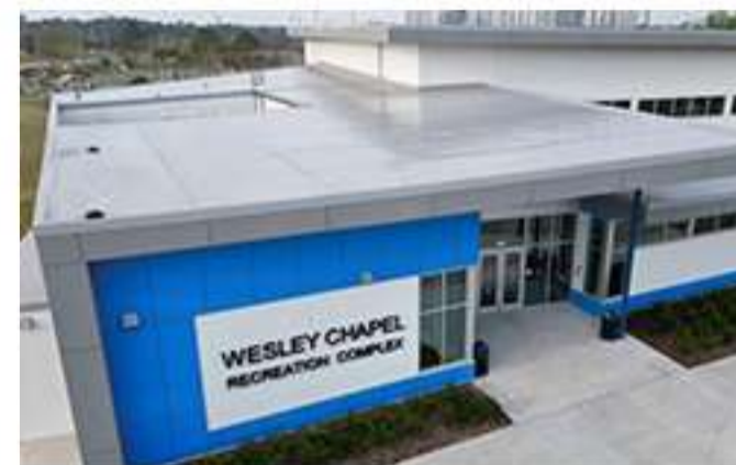
Parque Wesley Chapel