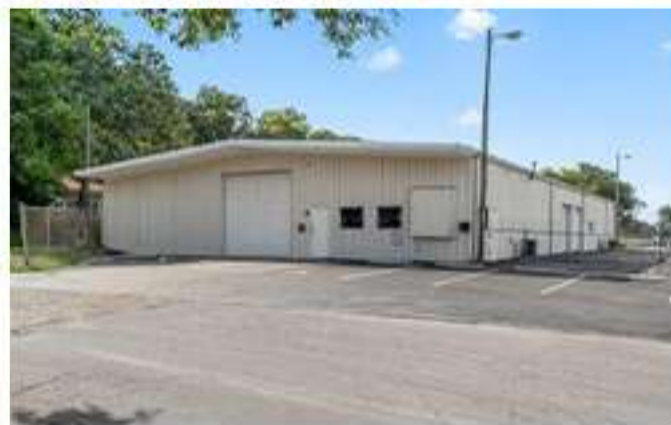
Almacén en Dade City