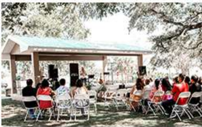
Parque en Dade City