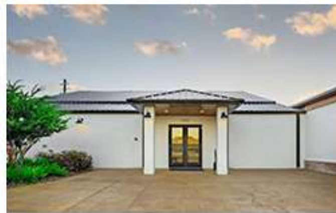
The Venue en Dade City