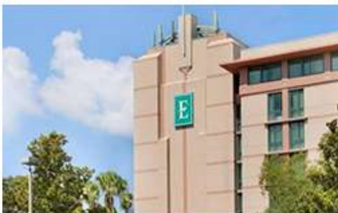
Hotel en Tampa